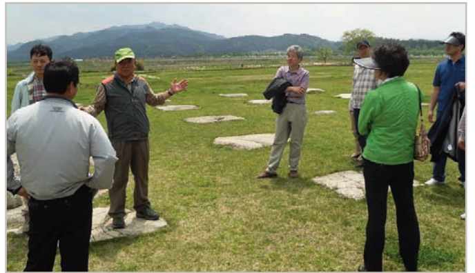
경주 황룡사지 9층 목탑터