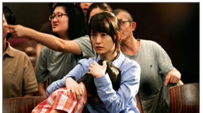
영화 '도가니'의 한 장면

언론의 역할과 기능이 무엇인가! 언론은 사회적 감시와 견제 기능에 충실해야 한다. 사회적 약자 편에 서서 소외되거나 피해를 입는 사람이 없도록 하고 불의와 싸워야 한다. 우리 사회의 잘못된 부분에 대해서는 과감히 '메스'를 들이댈 수 있어야 한다. 그동안 언론환경이 척박해지면서 경제적인 열악함을 핑계로 자본과 결탁하고 사회 기득권층과 영합하지는 않았는지 스스로 반성해야 한다. 본분을 잃은 언론은 독이 될 수 있음을 깨달아야 한다. 우리 사회가 건강하기 위해서는 언론이 늘 깨어 있어야 한다. '도가니' 사건도 언론이 외면하지 않았다면 보다 일찍 사회적인 파장을 불러 왔을 터이고, 새로운 차원에서 해결되었을 것이다. 그 오랜 기간 방치했다는 점에서 언론도 가해자로서의 책임을 통감해야 한다. '도가니' 사건은 언론이 본연의 사명을 깨닫고 재무장해야한다는 엄숙한 과제를 던져주고 있다.