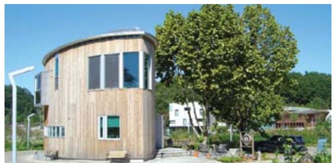
▲ 북카페 반디 외부 전경

“중국인 이야기 1”은 시오노 나나미의 “로마인 이야기”처럼 시대 순서로 쓰이지 않았다. 이것은 ‘즐기기 위한 독서’를 하는 사람에게는 단점이 아니다. 제목이 끌리는 것부터 읽어도 되고, 재미없으면 그 에피소드는 읽지 않으면 그만이기 때문이다. 🌈