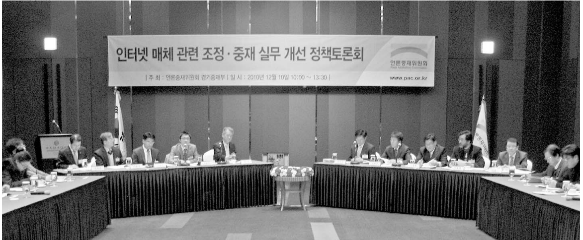
포털, 인터넷신문사, 신문사, 관계 행정부처 등에서 참석한 관계자들이 열린 토론을 벌이고 있다.

정하려는 경우 해당 기사를 공급한 자(기사제공 언론사)의 동의를 받아야 한다”고 명시하고 있다.