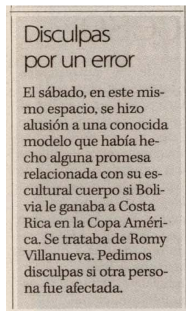
▲ La Razón 2011. 7. 12자 3면에 게재된 정정보도 3)

1990년에 창간된 라 라손(La Razón)은 볼리비아에서 두 번째로 큰 규모의 신문사이다. 약 300명의 직원이 일하고 있으며, 이 중 40명이 취재기자로 근무하고 있다. 안정된 재원을 바탕으로 주중에는 3만 5천부, 주말에는 4만 5천부를 발행한다. 몇 년 전까지 반정부 성향의 보도로 인해 정부로부터 많은