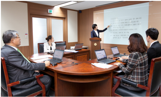
▲ 한국의료분쟁조정중재원 회의 모습