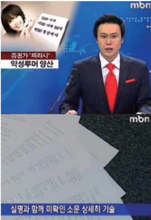
증권가 정보지의 문제점을 지적한 mbn보도(출처 : mbn, 「악성루머 양산 증권가 찌라시 '도마 위」, 2008년 10월 4일)