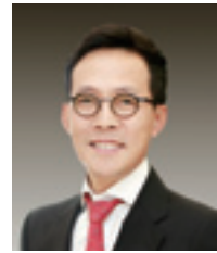
글. 임상혁 변호사, 법무법인 세종