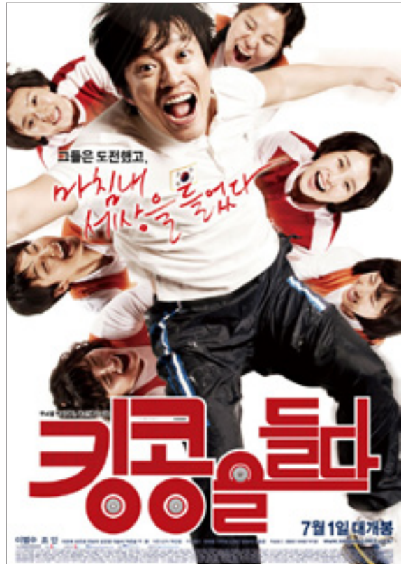
킹콩을 들다(2009) 포스터

규정에 등장하는 '부동자세'의 의미를 어떻게 판단하느냐에 따라서 심판마다 미세한 개인차는 있을 수 있다. 그러나 심판원의 신호로 선수가 바벨을 내려놓게 되므로, 경기의 결과를 판정 짓는 사람이 누구인지 금방 알 수 있다. 참여자인 선수 스스로 안다. 내가 이 무게를 들 수 있는지 없는지, 들어 올린 것인지 아닌지. 역도는 중력이라는, 만유인력의 법칙이라는 자연과의 우직한 싸움인 것이다. 어떻게 보면 역도경기의 실제 심판은 바로 선수 자기 자신이다.