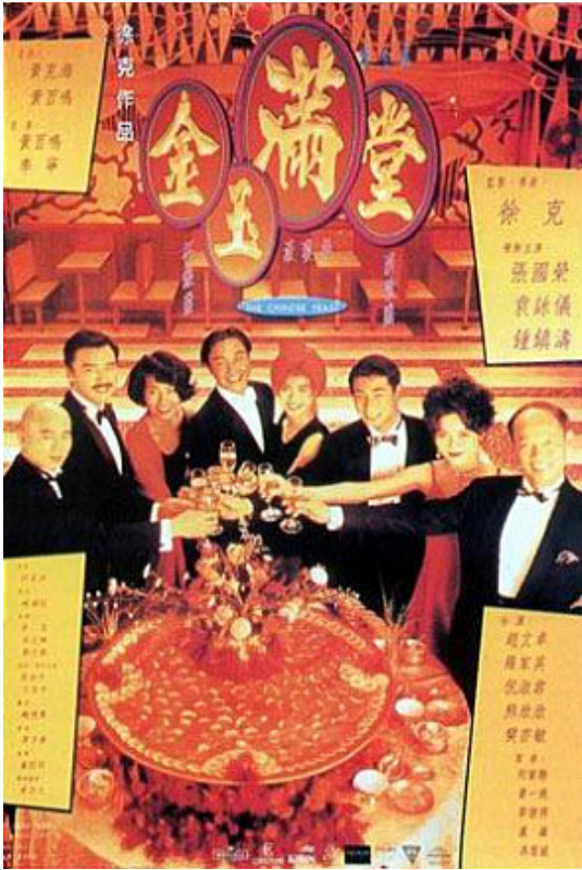
金玉만당(金玉滿堂, The Chinese Feast, 1995) 포스터

야구와 역도에 이은 세 번째는 승자는 기뻐하고 패자는 슬퍼할 테지만 정작 관객들은 남은 결과물에 관심을 가지는 경기인, 요리(料理)를 다룬 영화다. 서극 감독의 1995년 작 『金玉만당(金玉滿堂, The Chinese Feast)』은 장국영이 주연을 맡았는데, 요리경연을 소재로 다루고 있다. 요리경연에서는 색(色), 향(香), 미(味), 의(意), 형(形) 등 다섯 가지 항목으로 3명의 심판들이 각 요리(조리된 음식)를 ‘판정’하고 있다. 요리대회에서는 시각, 청각, 후각, 미각 등의 여러 감각이 동원된다.