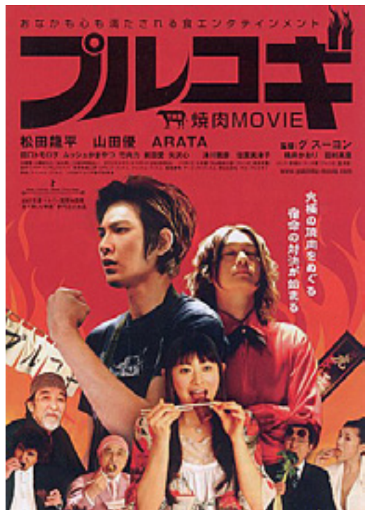
불고기(焼肉ムービー-ブルコギ, 2007) 포스터

‘국민 전체의 봉사자’로서 혹은 ‘공익의 수호자’로서, 법조인이 어떤 판단을 내리는지 또는 어떤 결정을 관철하는지에 따라 사건의 당사자 및 우리 사회에 미치는 파급효과도 크다. 그렇다면, 이러한 판단과 결정은 어떠한 근거에서 무엇을 기초로 이루어져야 하는 것일까. 혹시 스스로 그 판단의 기초가 부족할 때는 어떻게 해야 하는 것일까. 다음 가을호에서는 이에 대하여 이야기해보고자 한다. 행복한 여름 보내시길 빈다.