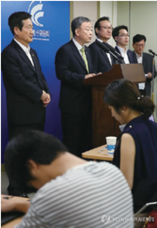
제3기 방통위 상임위원회 비전 및 주요 정책과제를 발표하고 있는 최성준 방통위원장

이와 같은 잊혀질 권리에 대한 논의와 관련하여 국내에서 가장 초점이 맞추어지는 부분은 잊혀질 권리를 어디까지 인정할 수 있을 것인가, 현행 개인정보보호 법령체계에서 잊혀질 권리를 보장할 수 있는 제도적 장치가 마련되어 있는 것은 아닌가, 잊혀질 권리와 다른 권리의 내용이 충돌할 경우 어느 법익이 우선적으로 고려되어야 하는가, 인격권으로서의 프라이버시권을 존중하는 유럽사법재판소의 판단과 개별 상황에 대한 판단을 기초로 한 불법행위(torts)로부터의 보호 대상으로 프라이버시권을 인식하는 미국의 입장에서 우리는 어느 입장에 서야 하는가 등이 될 것이다. 또한, 잊혀질 권리에 대한 주장에 반대되는 개념인 잊지 말아야 할 의무, 혹은 기억해야 할 의무(the duty to remember)에 대해 우리는 충분히 고민하고 있는가도 논의의 대상이 될 것이다.