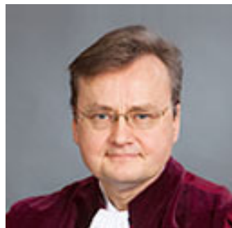
유럽사법재판소의 판결이 일반적인 잊혀질 권리를 규정하지 않는다는 의견을 표명한 EU 법무관 Niilo Jääskinen(출처: 유럽사법재판소 홈페이지[ curia.europa.eu ])

다섯째, 본 판결의 배경이 EU 검색시장을 90% 이상 점유하고 있는 미국 기반의 글로벌 기업 Google에 대한 유럽사법재판소의 판결이라는 점, 그리고 통상적으로 유럽사법재판소의 판단을 기속해왔던 유럽사법재판소 법무관 Niilo Jääskinen(Advocate General)의 의견도 본안에 대해서는 “1995년 EU 지