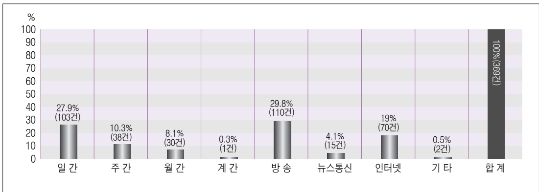
<표2-7> 매체유형별 소송빈도

인터넷 매체 중 법 소정의 인터넷신문으로서의 요건을 갖춘 매체는 70건 중 30건이었고, 언론사 닷컴이 27건, 포털사이트가 9건이었다.