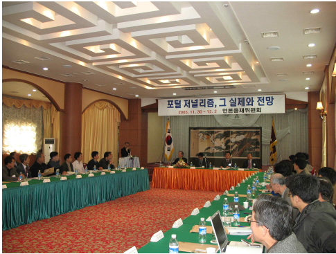
2005년도 위원회 정기 세미나

세미나는 언론분쟁의 한 당사자인 언론사 데스크와 중재위원, 그리고 각계 전문가가 함께 모여 언론법제와 윤리 관련 현안에 대해 토론함으로써 언론과 피해구제제도 및 위원회에 대한 이해를 높여 나가는 장으로 매년 1회씩 정기적으로 개최하고 있다.