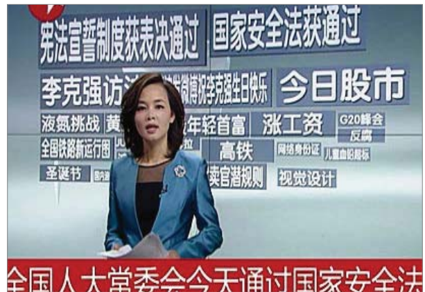
2015. 7. 1. 신 국가안전법이 전인대 상무위원회에서 통과 되었음을 보도한 신화사의 뉴스화면 캡처 (출처: 江苏警官学院保密办网站, 2015.7.10. “新国家安全法实施 明确建设网络与信息安全保障体系”, http://baomi.site.jspi.cn/Item/Show.asp?m=1&d=2078 )

이후, 2015년 7월 1일 신 국가안전법이 전인대 상무위원회에서 통과되었다. 신 국가안전법은 구법을 개정한 것이 아니라 새로운 국가안전의 개념을 반영하여 새롭게 제정한 것이다.