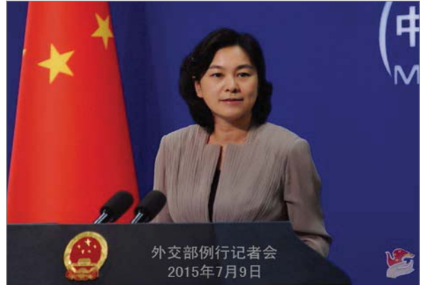
2015년 7월 9일 실시된 외교부 화춘잉(华春莹) 대변인의 기자회견 장면 (출처: CCTV, 2015. 7. 9. “UN의 국민의 자유 제한 발언과 관련한 중국 정부의 공식 입장을 표명” http://news.cntv.cn/2015/07/09/ARTI1436450164819156.shtml )

열 및 감독을 할 수 있는 근거로 해석할 수 있다. 정부의 과도한 검열과 감독에 대한 우려가 제기되자 2015년 7월 9일 중국 외교부 브리핑에서 화춘잉(华春莹) 대변인은 신 국가안전법의 핵심은 ‘인민 안전’이라고 강조하면서 국가안보의 모든 것이 인민을 위한 인민에 의한 것이라고 언급하였다. 그 근거로 신 국가안전법 제1조의 ‘인민의 근본이익 보호’, 제7조의 ‘인권의 존중과 보장, 합법적인 국민의 권리와 자유 보호’규정을 들었다. 또, 일부 조항에는 국가가 국민과 조직의 안보와 합법적 권익을 수호해야 한다는 규정도 있다고 밝혔다.