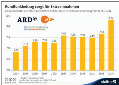
△ 공영방송의 연도별 방송분담금 수령액 추이

송사 재정수요조사위원회(KEF)의 보고서는 2013년부터 2016년까지 약 15억 유로의 추가 수입이 발생할 것으로 전망했다. 이처럼 방송 분담금 체제로 전환된 후, 공영방송의 재정적 기반이 공고해진 것으로 평가된다.