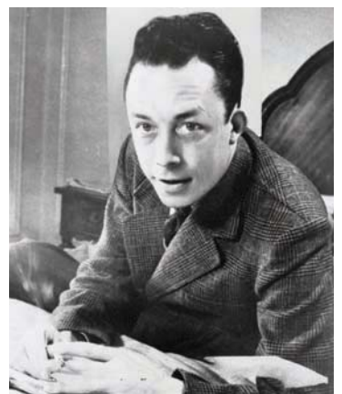
알베르 카뮈(Albert Camus, 1913년 11월 7일 ~ 1960년 1월 4일)는 프랑스의 피에 누아르 작가, 저널리스트 그리고 철학자였다.

[출처 : 위키백과( https://ko.wikipedia.org/wiki/알베르_카뮈 )]