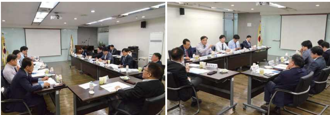
제21대 국회의원선거 선거기사심의위원회는 2020년 5월 15일 결산좌담회를 개최하여 심의위원회 운영 성과를 최종 평가하고 제도상의 문제점과 개선방안 등에 대해 논의했다.