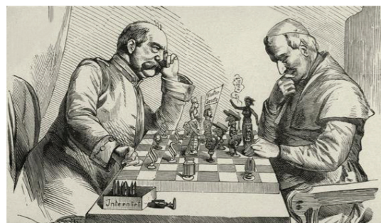
[그림 2] 체스 게임을 하는 비스마르크와 비오 9세의 풍자화

급기야 1875년에는 모든 결혼은 교회가 아니라 민법상으로 인정받을 것을 의무화한다. 그리고 이런 법을 따르지 않는 교구에 대해서는 지원을 철회하고 명령에 순응하지 않는 성직자들을 추방했다. 이러한 교정갈등은 1878년 비오 9세가 선종할 때까지 계속되었다. 그러나 다행히도 폭력적 수단이 동원되지는 않았다. 사실 교회는 이미 저항할 폭력적 수단을 가지고 있지 않았다. 이때 비스마르크를 지지했던 프러시아의 진보정치인이자 병리학자인 루돌프 피르쇼(Rudolf Virchow)는 이 시기에 벌어진 종교와 문화적 집단 간의 충돌을 문화투쟁(Kulturkampf)이라고 명명했다.