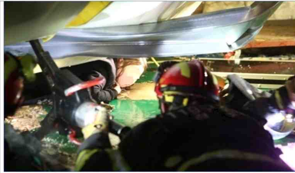
살려주세요 (경주) = 17일 오후 경북 경주시 마우나 리조트 붕괴 사고로 깔린 여학생이 구조의 눈길을 보내고 있다, 2014,2,17