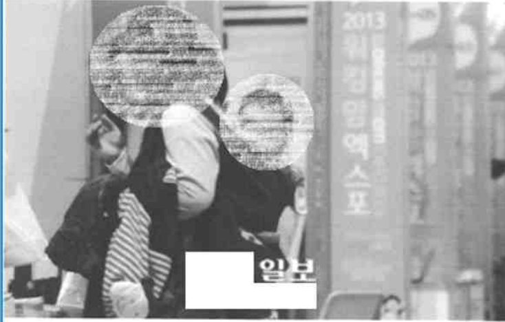
'워킹맘 엑스포'에 아이를 업고 온 여성이 채용부스에서 취업 상담을 받고 있다.