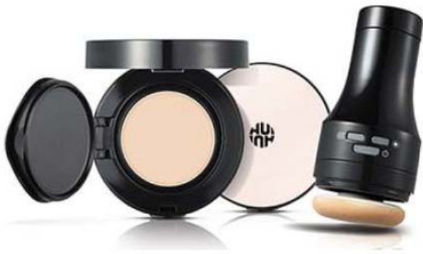
▲ LG생활건강은 메이크업 아티스트의 손길을 구현한 온열 진동기기로 완벽한 거울 메이크업을 완성해주는 '오취 오토 워밍 파운데이션'을 출시했다.

손으로 화장을 하지 않는 '코스메틱 디바이스' 시대가 서서히 열리고 있다.