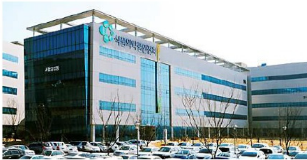
▲ 식품의약품안전처 식품의약품안전평가원은 화장품에 대한 관심과 소비가 커지는 추세에 따라 화장품 안전에 대한 궁금점 등을 해소하기 위해 ‘화장품의 올바른 선택 및 사용법’을 안내한다고 밝혔다.

화장품을 구매할 때는 반드시 광고 등에서 표명하는 성분이 들어있는지를 확인해야 한다. 현재 일부 화장품에서는 ‘000으로 피부의 주름이나 미백 등을 도와준다’ 또는 ‘000성분이 함유되어 있다’는 광고를 쉽게 찾아 볼 수 있다. 경쟁 제품과의 차별화 포인트다. 특히 구매 결정에 적잖은 영향을 주고 있다. 그러나 화장품 브랜드들이 주장하는 것에 대한 사실 확인이 어렵다. 따라서 식품의약품안전처는 국민들의 이 같은 문제를 조금이나마 해결하기 위해 ‘화장품의 올바른 선택 및 안전한 사용법’을 발표했다. 화장품은 인체의 청결 및 미화 또는 용모를 밝게 변화시키거나 피부와 모발의 건강 유지 등을 위해 바르거나 뿌리는 등의 방법으로 사용하는 유품으로 국내의 경우 ‘인체 세정용’, ‘기초화장용’, ‘두발 영색용’, ‘색조 화장용’ 등 총 12가지 유형으로 분류되어 있다고 설명했다. 특히 화장품은 의약품과 달리 뚜렷한 치료효과를 기대하기 어려울 수 있다며 이를 충분히 인식해야 한다고 밝히고 구매하려는 제품에 특정 성분의 포함 여부를 확인하는 것이 바람직하다고 강조했다. 또 현재 화장품법상 화장품의 용기나 포장에 모든 성분명의 기재를 의무화한 ‘전성분 표시제’가 시행