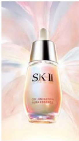
▲ SK II의 셀루미네이션 오라 에센스(이하 블루밍 에센스)가 인터넷에서 화제다.

SK II의 셀루미네이션 오라 에센스(이하 블루밍 에센스)는 피부 톤이 균일해지는 것이 장점인 반면 높은 가격이 단점으로 꼽혔다. 그동안 SK II가 애지중지해왔던 셀루미네이션 에센스(광채 에센스)를 단종시키면서 올해 2월초에 본격적인 화이트닝 시즌에 맞춰 셀루미네이션 오라 에센스(블루밍 에센스)를 내놓았다. 후발 주자인 셈이다. 현재 수 많은 뷰티 피플들이 블루밍 에센스를 사용해 본 리뷰는 인터넷에서 쉽게 찾아볼 수 있다. 헤아릴 수 없을 정도로 많다. 이들 대부분은 장점으로는 피부 톤이 밝아지면서 화사해 지는 것을 느낄 수 있었다고 입을 모으고 있다. 10일 정도를 꾸준히 바르면 피부가 하얘지는 드라마틱한 화이트닝 효과 보다는 피부가 화사해 지면서 피부 톤이 균일해 지고 붉은기가 완화되는 것을 경험했다며 사용하기 전과 10일후의 비교 인증 샷(사진)을 올려놓고 있다. 특히 이들은 보통 에센스는 짙은 느낌이 있지만 블루밍 에센스는 이 같은 끈적임이 없으며 가벼운 로션이라는 생각이 들 정도로 밝히고 바르는 순간 흡수가 빠르고 촉촉해 진다고 얘기하고 있다. 또 스프레이 타입이므로 적당한 량을 사용할 수 있는 등 양 조절이 가능하고 얼굴에 바를 때 편리성을 갖고 있다. 위생적이다 라고 평가하고 있다. 한 네티즌은 기름종이에 블루밍 에센스를 떨어뜨리고 한시간 후에 이를 확인한 결과 기름 종이에 유분기를 볼 수 없었다며 밝히고 또한 네티즌은 손등에 블루밍 에센스를 바른 후 종이를 붙였는데 모두 떨어졌다고 끈적임이 없다는 것을 증명해 주었다. 반면 블루밍 에센스의 단점으로는 30ml에 17만 5천이라는 가격이 부담스럽다고 말하고 제품 용기 뒷면에 일본어 너무 많이 기재분해 보인다고 지적하고 있다.