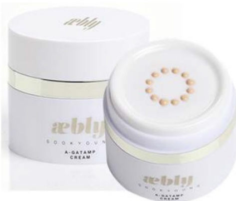
▲ GS샵은 오는 4월5일(토) 오후1시부터 신개념 만능 크림'에블리 아가탬프 크림'의 런칭 방송을 실시한다.

GS샵은 오는 4월5일(토) 오후1시부터 신개념 만능 크림'에블리 아가탬프 크림'의 런칭 방송을 실시한다.