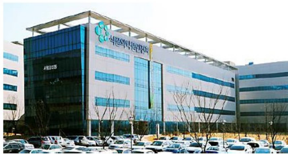
▲ 식약처는 화장품을 보관할 때는 직사광선을 피해 서늘한 곳에 보관하는 좋다고 밝혔다.