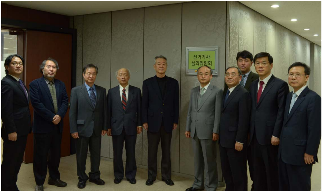
〈2012년 제19대 국회의원선거 선거기사심의위원회 출범 사진〉

체심의회여 적절한 제재조치를 의결한다. 그리고 후보자(후보자가 되고자 하는 자)가 선거기사가 불공정하다고 판단하여 심의위원회에 시정을 요구할 경우 이를 심의·의결하며, 후보자나 정당(중앙당)이 언론사에 반론보도를 청구했으나 협의가 결렬되어 심의위원회에 회부될 경우 이를 심의·의결한다.