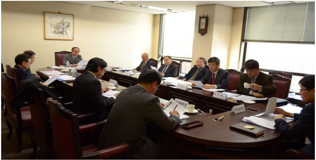
〈선거기사를 심의하고 있는 선거기사심의위원회 회의 장면〉