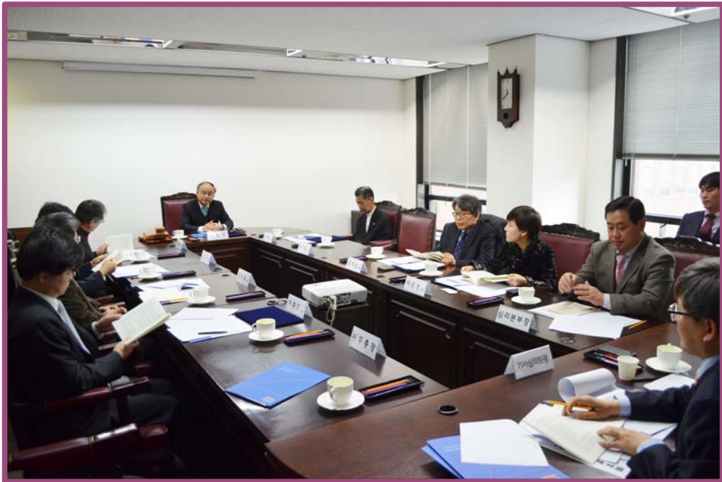
〈선거기사를 심의하고 있는 선거기사심의위원회 회의 장면〉