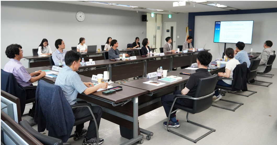
▲ 제21대 대통령선거 선거기사심의위원회는 2025년 7월 1일 결산좌담회를 개최하여 운영 성과를 최종 평가하고 제도의 개선방안 등에 대해 논의했다.