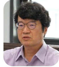
박 홍 래 심의위원장

이번 대선 선심위에서는 시정요구심의가 없었지만, 앞으로는 정당의 시정요구 심의 신청을 허용하는 방안을 검토하거나 보다 다양한 유형의 안건을 탐색하는 등 위원회의 역할을 확대할 필요가 있다고 생각합니다. 또한, 동일한 심의기준을 위반한 경우 소규모 언론사에 대형 언론사와 동일한 제재조치를 결정하는 것이 적절한지에 대해서도 검토해 볼 필요가 있다고 봅니다. 이번 선심위에서는 위원님들께서 공정하고 치밀하게 논의해 주신 덕분에 의미 있는 성과로 이어졌다고 생각합니다. 사무처의 지원에도 감사드립니다.